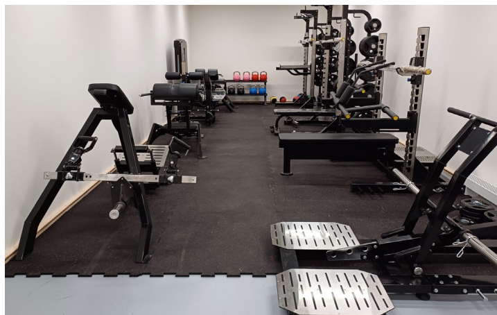
Fitness centrum se již připravuje na první návštěvníky