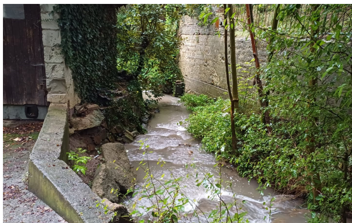
Lysolajský potok během své kulminace