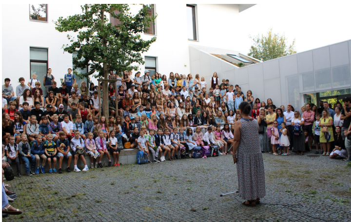
Slavnostní zahájení nového školního roku