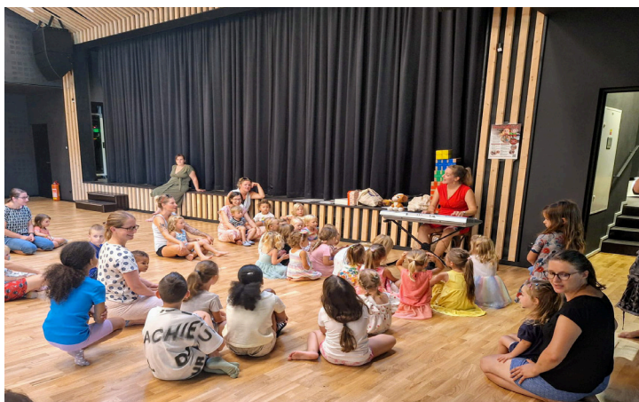
Hudebníci rozezvučili sokolovnu