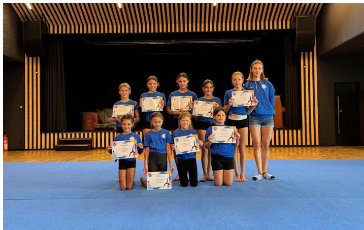
Oddíl sportovní gymnastiky zahájil svou činnost