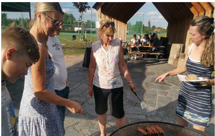
Babí léto v bývalé pískovně