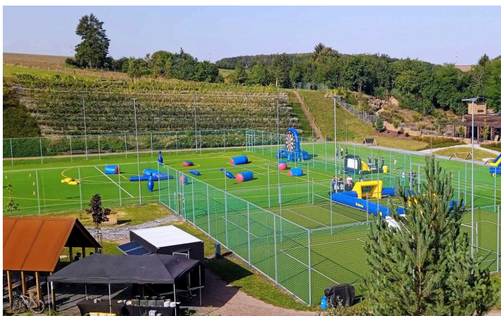
Sportovní den v našem areálu