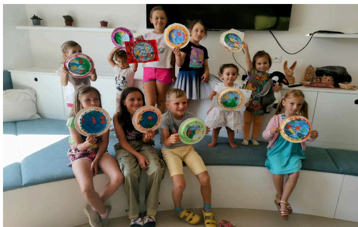
V komunitním centru se i přes léto tvořilo